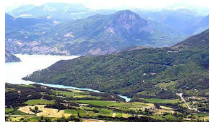
L'extrémité aval du lac de Serre-Ponçon et Clot la Cime

Les deux photos suivantes, de même que la première image Google Earth ci dessous, permettent de vérifier facilement que le premier critère est bien rempli. La carte qui fait suite montre bien que le glacier principal, celui de la Durance, recevait ici l'appoint des glaces de l'Ubaye.