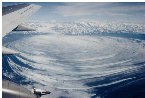
Le lobe du glacier Malaspina vu d'avion, d'environ 8.000 m